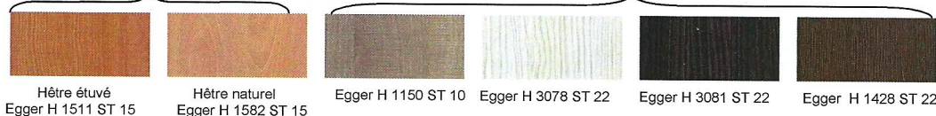
Hêtre étuvé Egger H 1511 ST 15