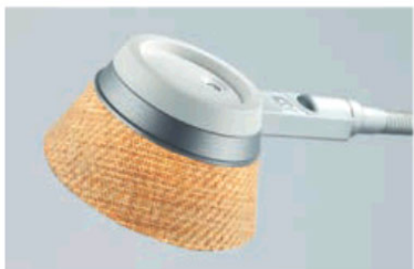
Abat-jour à motifs