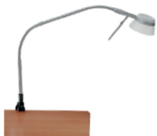
Amalia 9 P S7 avec col de cygne