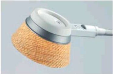
Dekore für Leuchtschirm