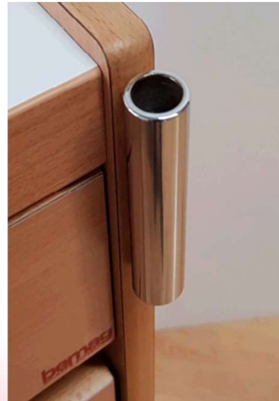
Leuchtenhalter für Nachttische