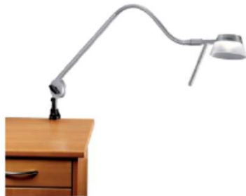
Amalia 9 P S4 mit Gelenk