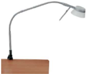
Amalia 9 P S7 mit Schwanenhals